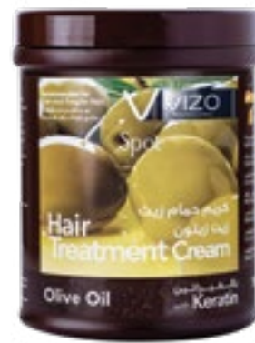
Olive oil Fine and fragile hair زيت زيتون للشعر الرفيع والضعيف 1000 ml