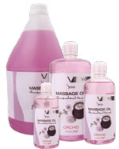
Massage Oil Orchid زيت تدليك - اوركيد