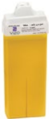
Classic Wax With Small Roll شمع الكلاسيكي مع لفة الصغيرة