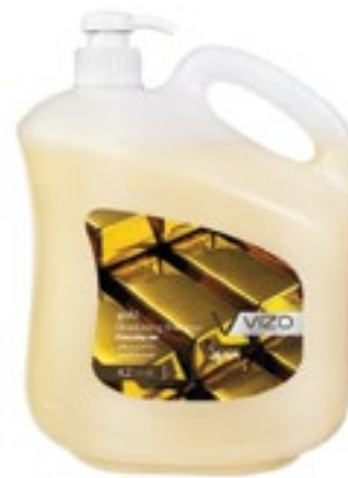
Gold For All Hair Types