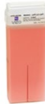
Strawberry شمع بنكهة الفراولة