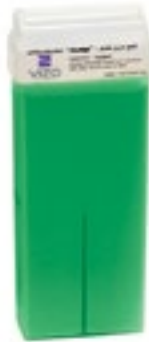
Kiwi شمع بنكهة الكيوي