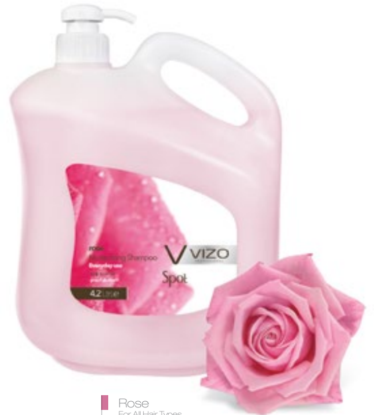
Rose For All Hair Types