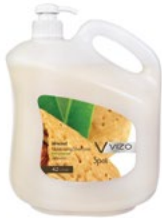
Almond For All Hair Types

تركيز مضاعف ■ تركيبة متطورة لا تسبب الحساسية لفروة الرأس ■