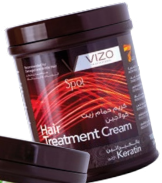
Collagen For Damaged and Brittle Hair كولاجين للشعر الجاف والتالف 1000 ml