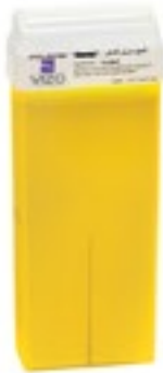
Pineapple شمع بنكهة الأناناس