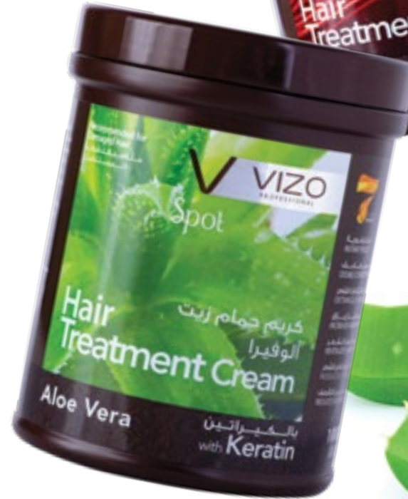
Aloe Vera For Damaged Hair ألو فيرا للشعر التالف 1000 ml