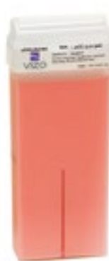
Classic Pink Wax شمع الكلاسيكي وردي