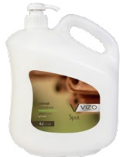
Oriental For All Hair Types