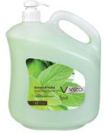
Herbal For All Hair Types