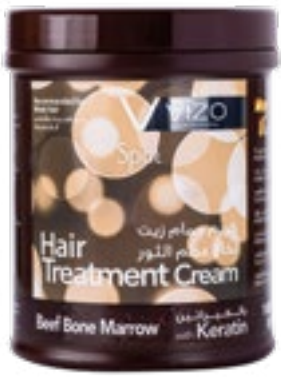
Beef Bone Marrow Weak Hair نخاع عظم الثور للشعر الضعيف 1000 ml