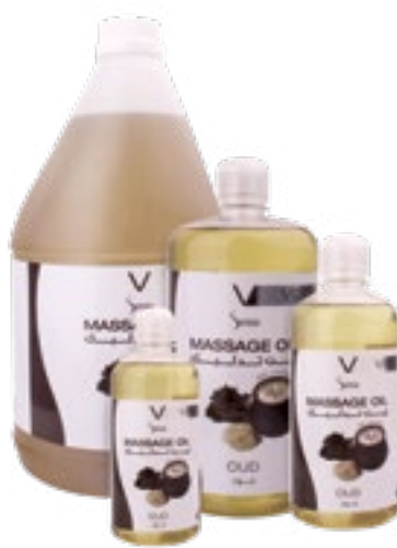
Massage Oil Oud زيت تدليك - عود

فيزو سينسيا زيت المساج (تدليك) يأخذ تجربة التدليك الخاصة بك إلى مستوى جديد كلياً. خليطنا من الزيوت الأساسية مختار بعناية يعيد التوازن إلى العقل، الجسد والروح. تركيبتنا الفريدة الغنية والغير دهنية، تضمن عدم بقاء اي اثار زيتية!