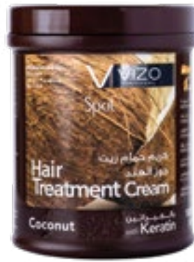
Coconut Dry hair جوز الهند للشعر الجاف 1000 ml