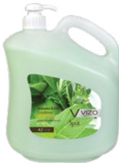
Herbal For All Hair Types