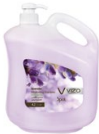
Lavender For All Hair Types