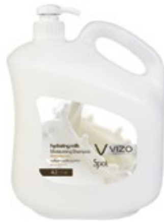
Milk For All Hair Types