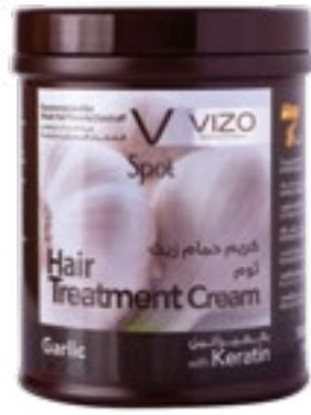
Garlic Weak hair prone to dandruff ثوم للشعر الضعيف المعرض للقشرة 1000 ml