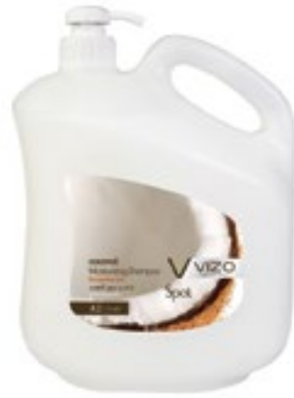
Coconut For All Hair Types