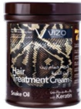
Snake oil Fine and Breaking hair زيت الحية للشعر الرفيع والمعرض للتكسر 1000 ml