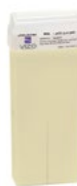
Classic White Wax شمع الكلاسيكي أبيض