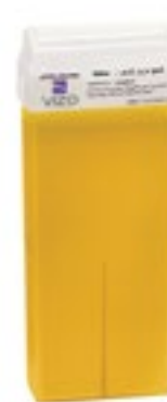
Classic Yellow Wax شمع الكلاسيكي أصفر