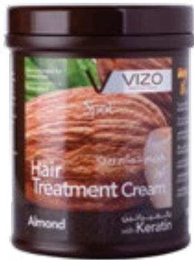
Almond Colored Hair لوز للشعر المصبوغ 1000 ml