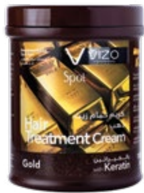
Gold Dull hair ذهب للشعر الباهت 1000 ml