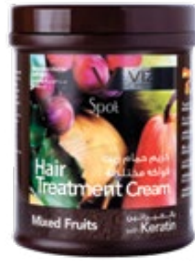
Mixed fruit Dull hair فواكه مختلطة للشعر الباهت 1000 ml