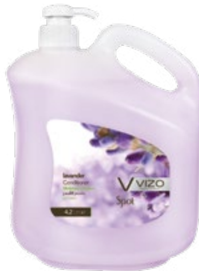
Lavender For All Hair Types