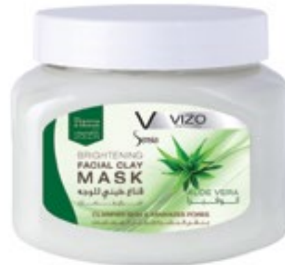
Aloe Vera الوفيرا