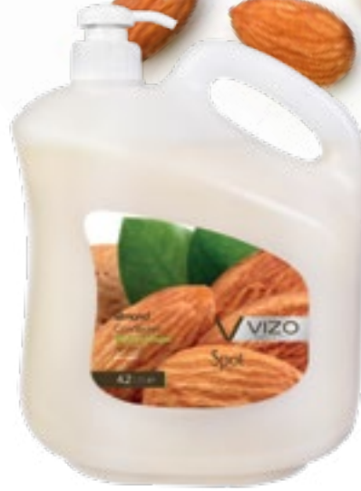
Almond For All Hair Types