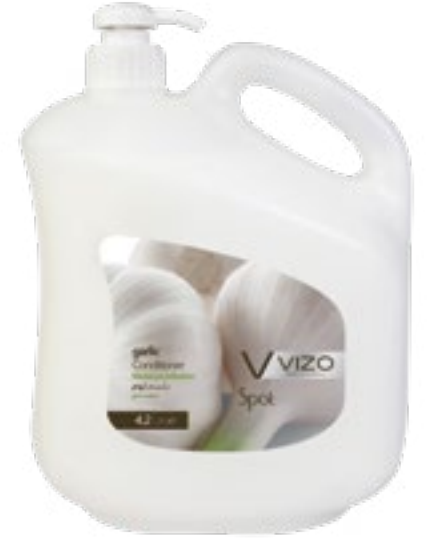
Garlic For All Hair Types