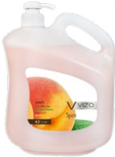
Peach For All Hair Types