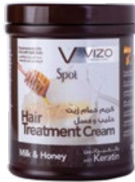
Milk & Honey Hair with split ends حليب وعسل للشعر المعرض للتقصف 1000 ml