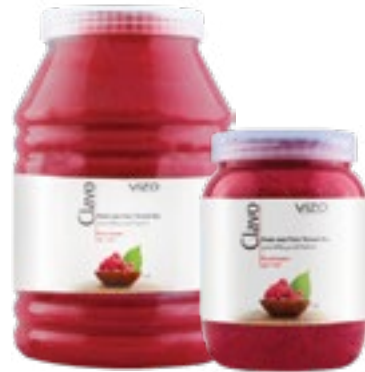
Raspberry توت بري