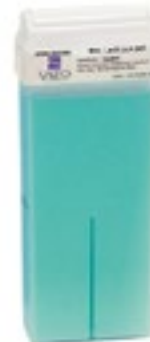
Blue شمع كلاسيكي أزرق