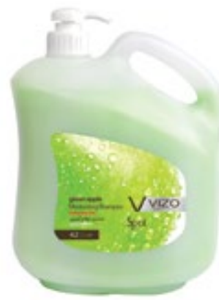
Green Apple For All Hair Types