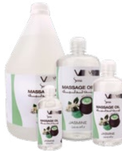
Massage Oil Jasmine زيت تدليك - ياسمين