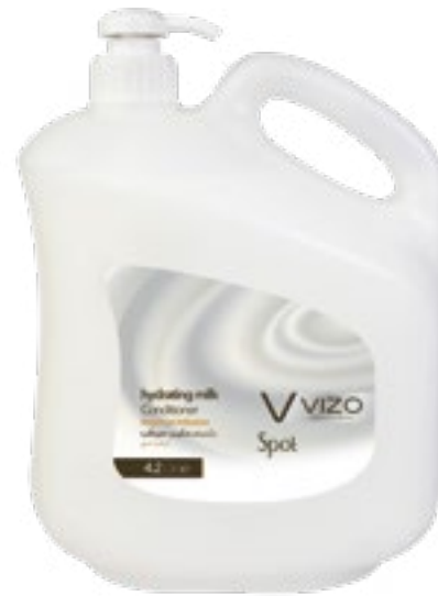
Hydrating milk For All Hair Types