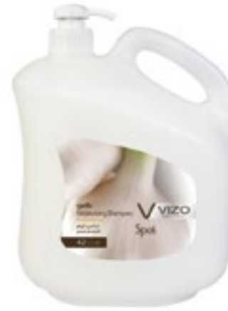
Garlic For All Hair Types