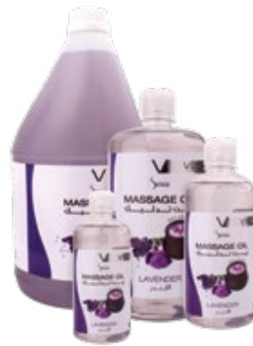
Massage Oil Lavender زيت تدليك - لافندر