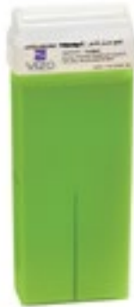
Green Apple شمع بنكهة التفاح الأخضر