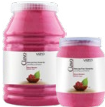
Mixed Berries توت مشكل