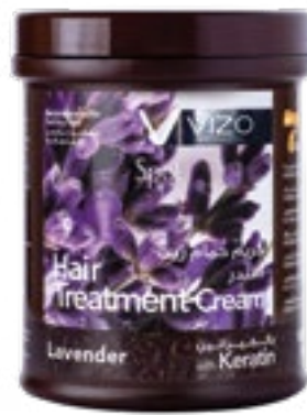
Lavender Falling hair لافندر للشعر المتساقط 1000 ml