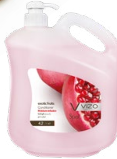
Exotic Fruits For All Hair Types