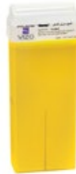
Lemon شمع بنكهة الليمون