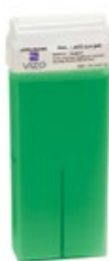
Classic Green Wax شمع الكلاسيكي أخضر